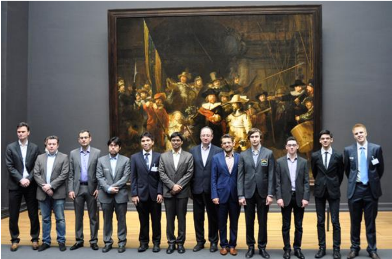
Οι «Masters» ποζάρουν μπροστά από τον περίφημο πίνακα του Rembrandt στο Rijksmuseum του Amsterdam.