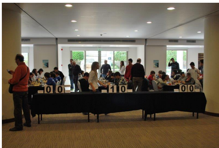
Γενική άποψη του αγωνιστικού χώρου στο ξενοδοχείο LUCY.