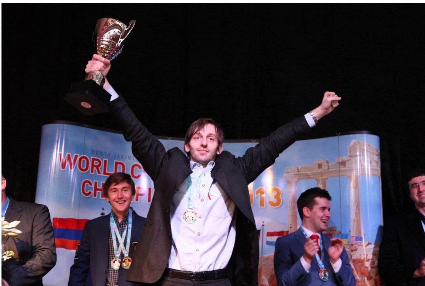
Ο Α. Grischuk (με το κύπελλο) και οι υπόλοιποι παίκτες της Ρωσίας, περιχαρείς για την επιστροφή τους στο υψηλότερο σκαλί του βάρου!

Η διοργάνωση καλύφθηκε διαδικτυακά από την ιστοσελίδα http://wctc2013.tsf.org.tr/ , στην οποία μπορείτε να βρείτε αναλυτικά τα αποτελέσματα ανά γύρο, τις παρτίδες, αλλά και πλούσιο φωτογραφικό υλικό.