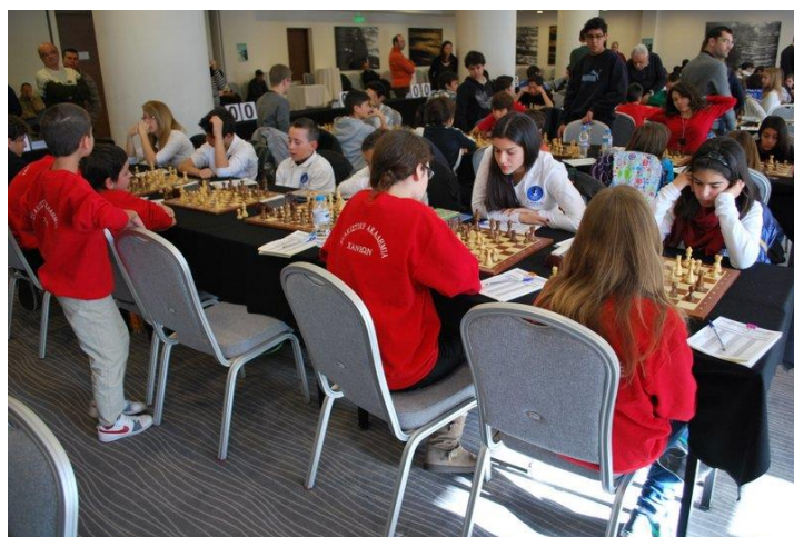
Στιγμιότυπο από την αναμέτρηση Σ.Α. Χανίων – Σ.Ο. Καβάλας του καθοριστικού τελευταίου γύρου, που έκρινε τη 2 η θέση.