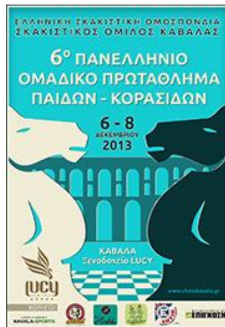
Η αφίσα των αγώνων.

Η ζωντανή μετάδοση των παρτίδων (24 από τις 48) έγινε από τους Αλέξη και Σάββα Μανελίδη και τους Θανάση και Χρήστο Χατζηδημητριάδη.