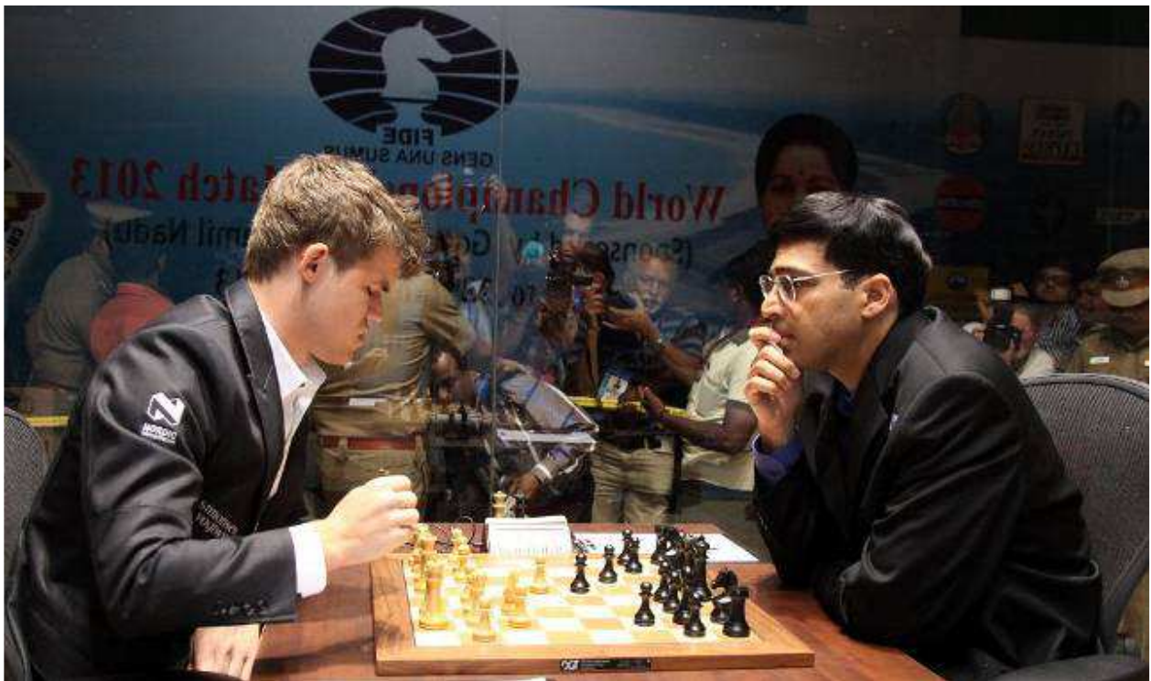
Κάρλσεν-Αναντ, 1 η παρτίδα του ματς

Η τελετή έναρξης έγινε στις 7 Νοεμβρίου, στο κλειστό στάδιο Νεχρού, με την παρουσία χιλιάδων θεατών.