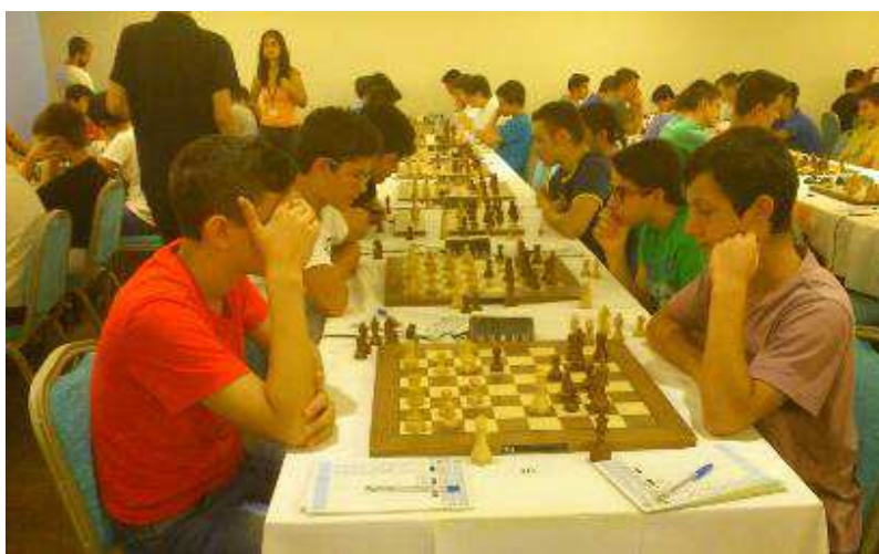
Από την τελική φάση των ατομικών νεανικών στο Ρίο (Ιούλιος 2013)

Στην τελική φάση που θα διεξαχθεί στην Καβάλα (6-8/12/2013) θα λάβουν μέρος οι παρακάτω 16 ομάδες.