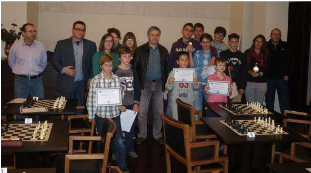
Αναμνηστική φωτογραφία με τους συμμετέχοντες μετά το πέρας των Κελέτρειων 2013.