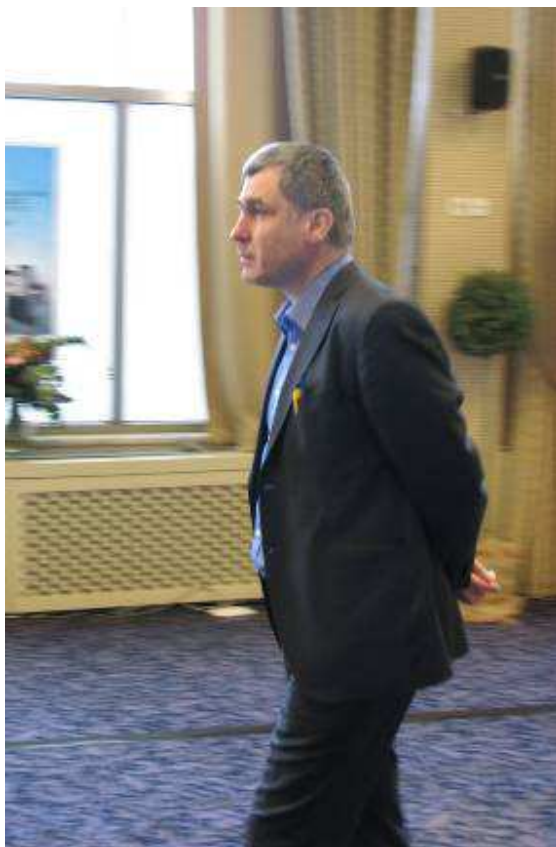
(13) Ivanchuk,Vassily (2755) - Dominguez Perez,Leinier (2723) [D86]

Κάποια στιγμή ο Χουντίνι 3.0 έδινε στον Ιβαντσούκ πλεονέκτημα +14.0 !!