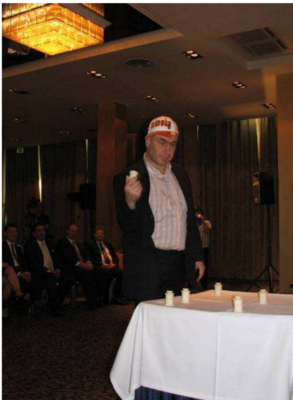
Από την τελετή έναρξης: Βασίλι Ιβαντσουκ