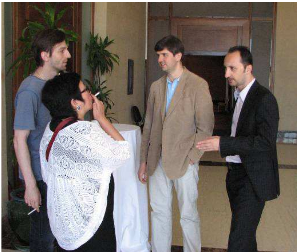
Ένα τελευταίο τσιγάρο πριν την παρτίδα

Εξαιρετικό ήταν το ποσοστό του Γκάτα Κάμσκι με τα λευκά (83%), ενώ πολύ καλό ήταν και το ποσοστό του Ντομίνγκεζ (80%). Πολύ καλό ήταν το ποσοστό του Ντομίνγκεζ και του Καρουάνα με τα μαύρα (67%). Απογοητευτικό ήταν το ποσοστό του Σβίντλερ και του Νακαμούρα με τα μαύρα (20% και 25% αντίστοιχα ).