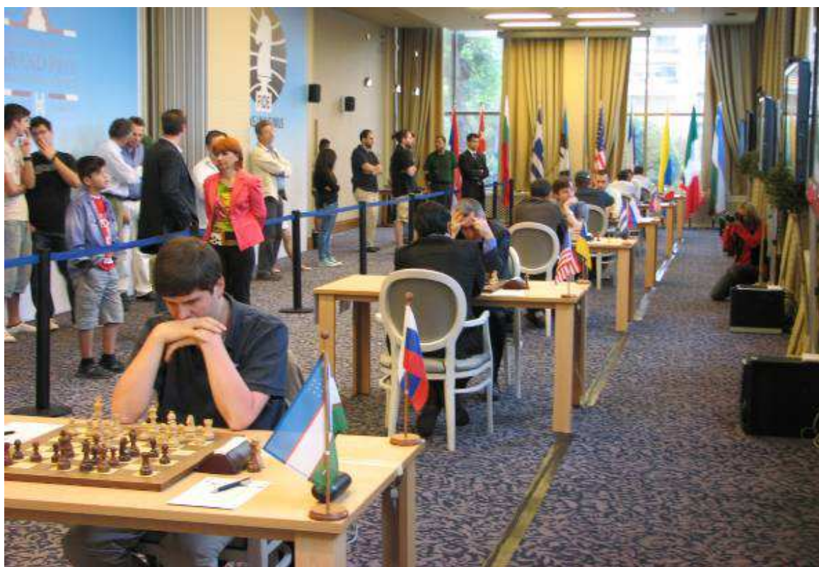
Γενική άποψη της αίθουσας των αγώνων